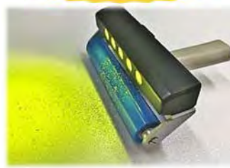
EZライト付きハンドローラ

人間工学に基づいたこだわりの設計 により使いやすく、耐久性が高く、 長持ちするので結局お得になります!! オプション品のライトは、異物や キズを見逃さずに不良を削減します!! 検査用途などでご要望が多かった、 常時点灯型がついに発売しました!