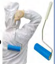
トレールローラー